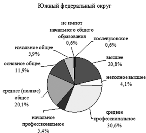
Рис. 4. Уровень образования населения в Южном федеральном округе (по данным Всероссийской переписи населения 2010 года), % среди участников переписи в возрасте 15 лет и старше, указавших уровень образования) [19, с. 234-235]

интернета от Республики Северная Осетия — Алания, относящейся к Северо-Кавказскому федеральному округу.