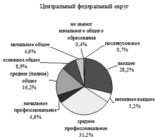
Рис. 3. Уровень образования населения в Центральном федеральном округе (по данным Всероссийской переписи населения 2010 г., % среди участников переписи в возрасте 15 лет и старше, указавших уровень образования) [19, с. 234-235]