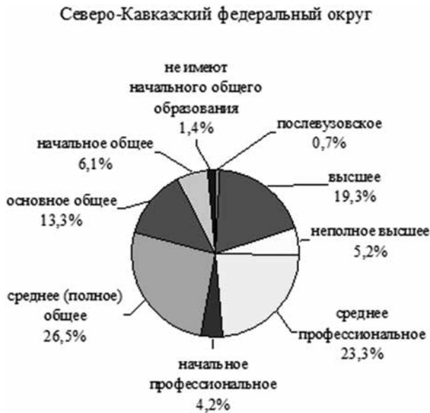
Рис. 5. Уровень образования населения в Северо-Кавказском федеральном округе (по данным Всероссийской переписи населения 2010 года), % среди участников переписи в возрасте 15 лет и старше, указавших уровень образования [19, с. 234-235]

отнести еще и специфические институциональные факторы, детерминирующие формирование периферийных институциональных систем, которые в целом консервируют архаичные институты, препятствующие модернизации общества в целом и экономики, в частности.