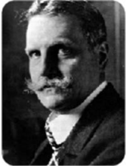
Роберт Михельс (1876-1936)

Роберт Михельс в 1910 году сформулировал свой знаменитый «железный закон олигархии» , согласно которому у политических организаций существует тенденция трансформироваться в олигархические, несмотря на то, что они могут стремиться к внутренней демократии.