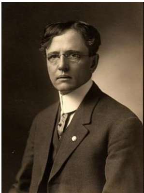
Джон Роджерс Коммонс (1862-1945)

В рамках институциональной экономики проблема коллективных действий впервые и наиболее глубоко была исследована Джоном Коммонсом.