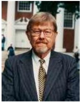
Манкур Олсон (1932-1968)

Манкур Олсон является известнейшим экономистом, который занимался проблемой коллективных действий.