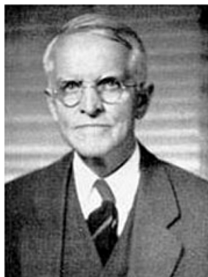
Уэсли Клэр Митчелл (1874–1948)

У. Митчелл учился в Чикагском университете, стажировался в Венском и работал в Колумбийском университете (1913–1948 гг.). В 1920 он возглавил Национальное бюро экономических исследований. В центре внимания ученого находились вопросы деловых циклов и исследования экономической конъюнктуры. У.К. Митчелл оказался первым институционалистом, анализирующим реальные процессы «с цифрами в руках».