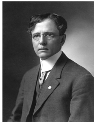
Джон Роджерс Коммонс (1862–1945)

Родители Джона Коммонса развили в нем склонности к независимости, бунтарству и ереси. Это наложило отпечаток на всю его жизнь, в которой он неоднократно ссорился со своими университетскими начальниками. Окончил Оберлин колледж, в 1888–1890 гг. учился в университете Джона Хопкинса в штате Мэриленд. С 1904 по 1932 г. — профессор Висконсинского университета. В 1917 г. был избран президентом американской экономической ассоциации.