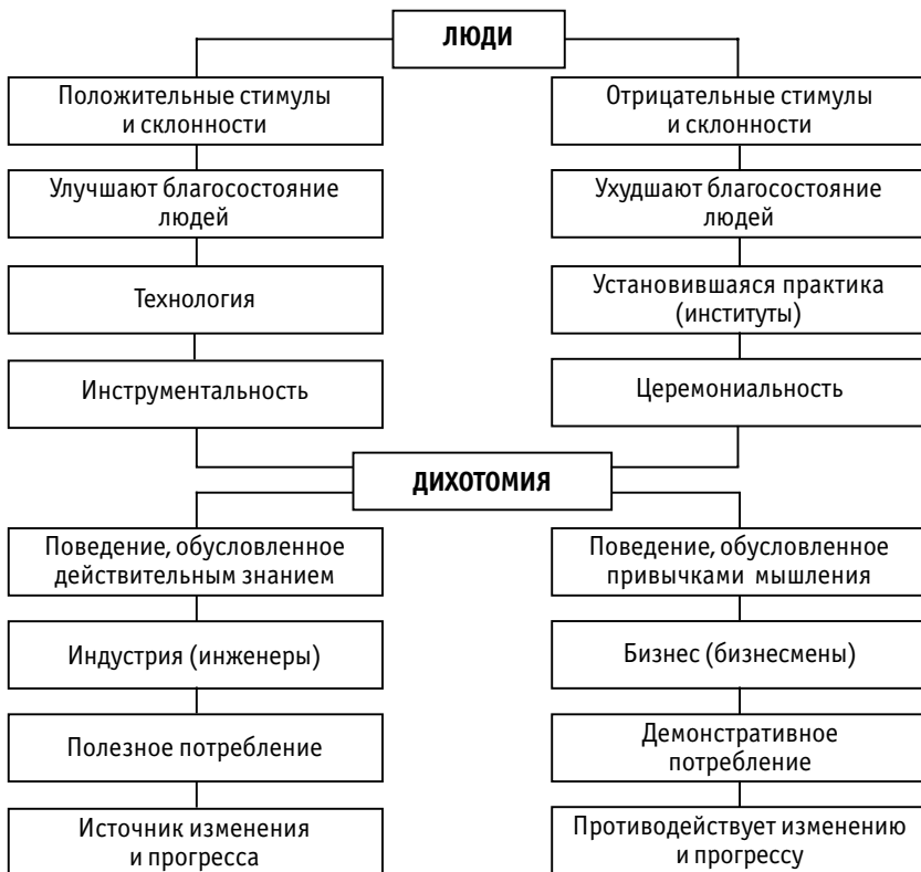
Рис. 2.1. Дихотомия Веблена

изменений и прогресса. Носителями этих положительных черт, по мнению Т. Веблена, являются инженеры. Именно технократы обладают необходимыми и достаточными знаниями, навыками и умениями, без которых невозможно приводить институциональные формы в соответствие с новейшими технологическими изменениями. Наоборот, поведение, обусловленное привычками мышления, установившаяся практика