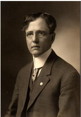
Джон Роджерс Коммонс (1862-1945)

Однако в институциональной экономике под трансакциями понимается более сложные экономические отношения.